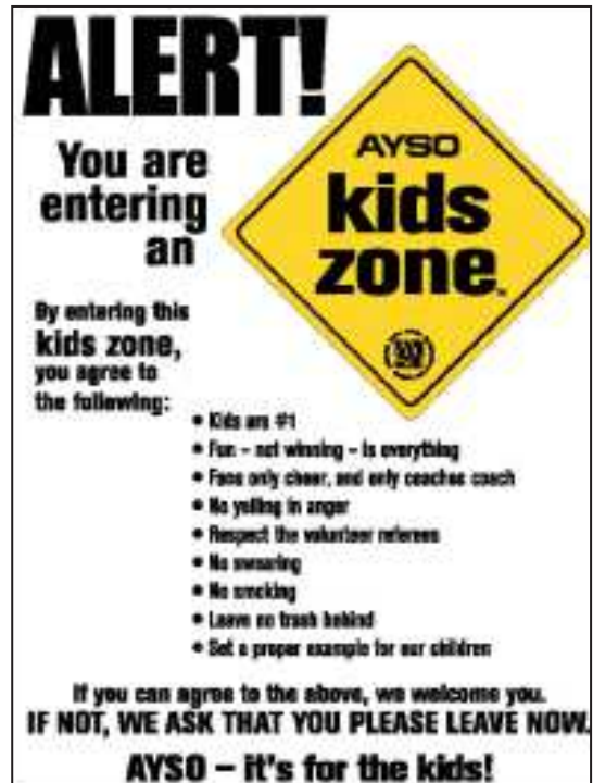
「注意！あなたはキッズゾーンに入ろうとしています」アメリカ